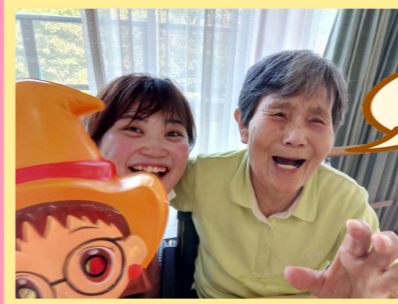
たこ焼き 美味しかったよ！