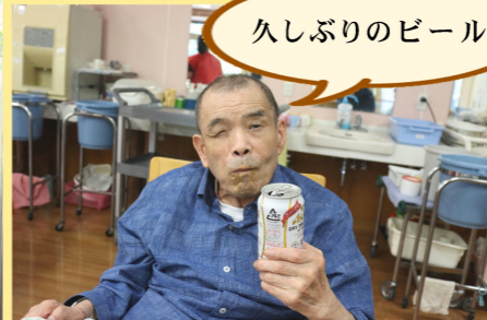
久しぶりのビール