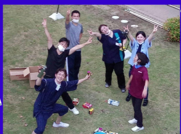
24mのナイヤガラ花火