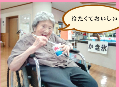
冷たくておいしい