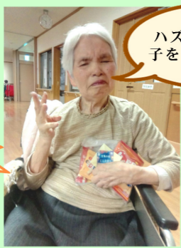
ハズレでもお菓子 をもらいました