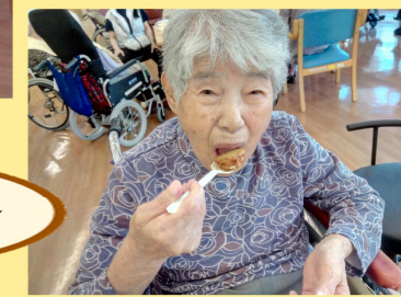
いらっしゃいませ～