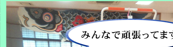
みんなで頑張ってます!