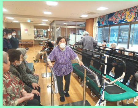
1、2、3、4...! かけ声に合わせて!